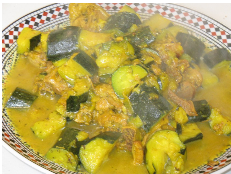
Notre tajine poulet - courgettes du mois d'avril ;)

Un atelier à recommander aux inscrits à la Maison Médicale ! »